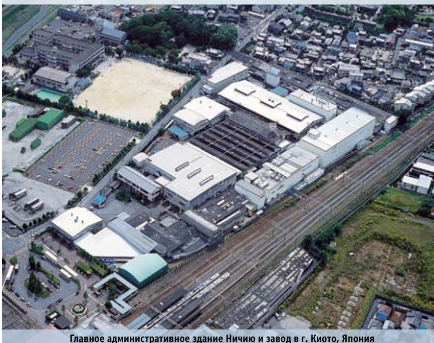
Главное административное здание Ничиу и завод в г. Киото, Япония

Известно ли вам, кто первым в Японии разработал погрузчик для работы на рефрижераторном складе? Еще в 1965 году это сделала японская компания Nippon Yusoki Co., Ltd., и сегодня выпускающая под торговой маркой Nichiyu качественный и надежный электроприводный напольный транспорт, отлично известный специалистам, работающим со скоропортящейся, охлажденной или замороженной продукцией. Компания создала целую оборонительную систему защиты, которая надежно предохраняет технику от воздействия низких (выше -35^{\circ}\text{C} ) и очень низких (выше -55^{\circ}\text{C} ) температур. Складское подъемное оборудование, предназначенное для работы на холоде, можно назвать настоящим шедевром японских конструкторов. Не случайно «морозоустойчивые» модели Nichiyu принимали участие даже в японской антарктической экспедиции!