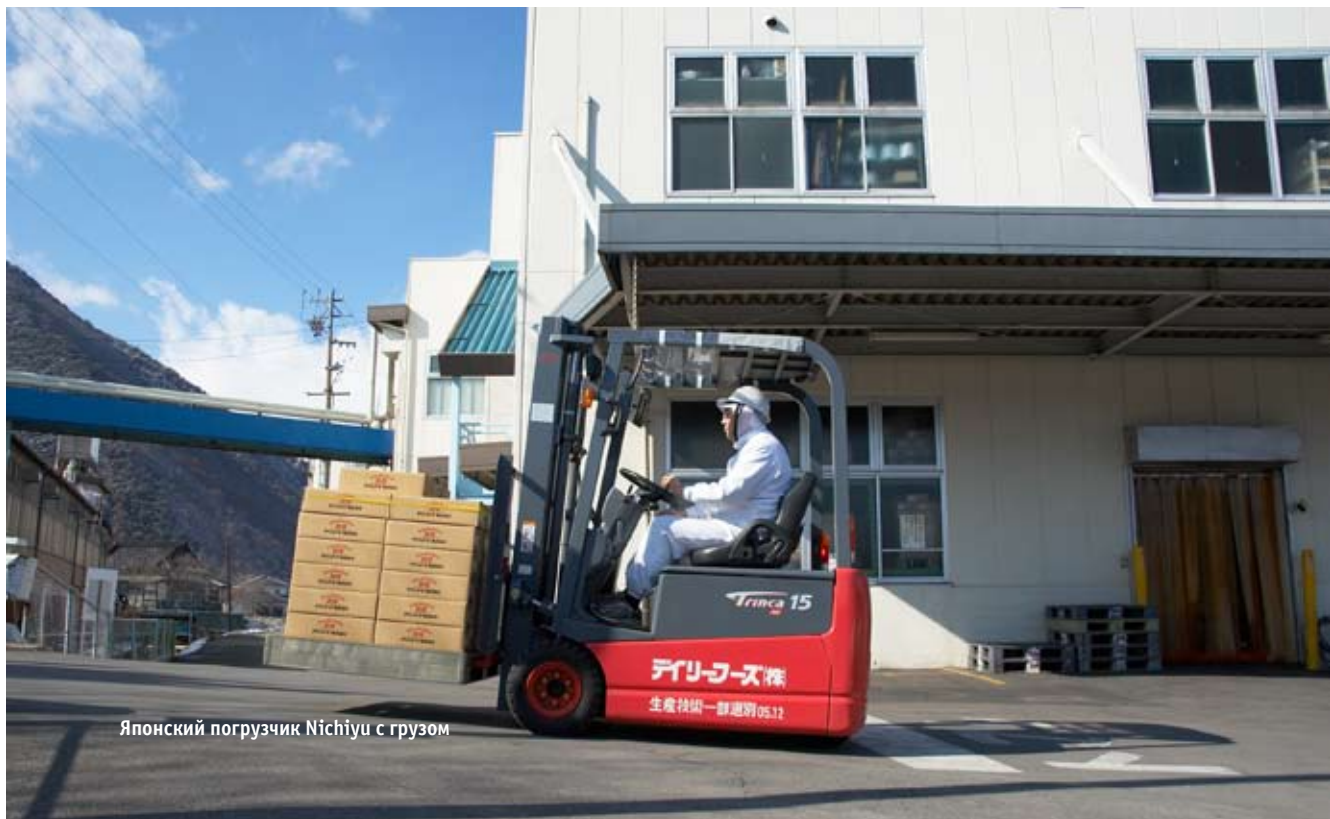
Японский погрузчик Nishiyu с грузом