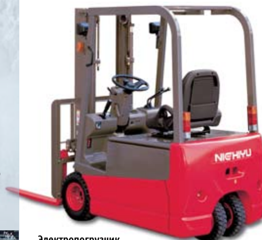
Электропогрузчик FBT-70 класса CS

М ясная, рыбная, молочная, плодовоовощная, фармацевтическая, косметическая промышленность, производство мороженого и многие другие отрасли применяют в технологических процессах промышленные склады-холодильники, где погрузочная техника должна работать в условиях низких температур. Большинство предприятий пищевой и перерабатывающей промышленности в России используют на своих хладокомбинатах физически и морально устаревшее оборудование, не отвечающее современным требованиям промышленной и экологической безопасности, а электропогрузчики российского производства проигрывают зарубежной технике по характеристикам работы в условиях низких температур.