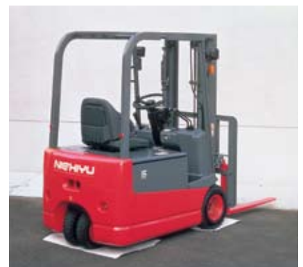
Электропогрузчик с противовесом FBT класса CS