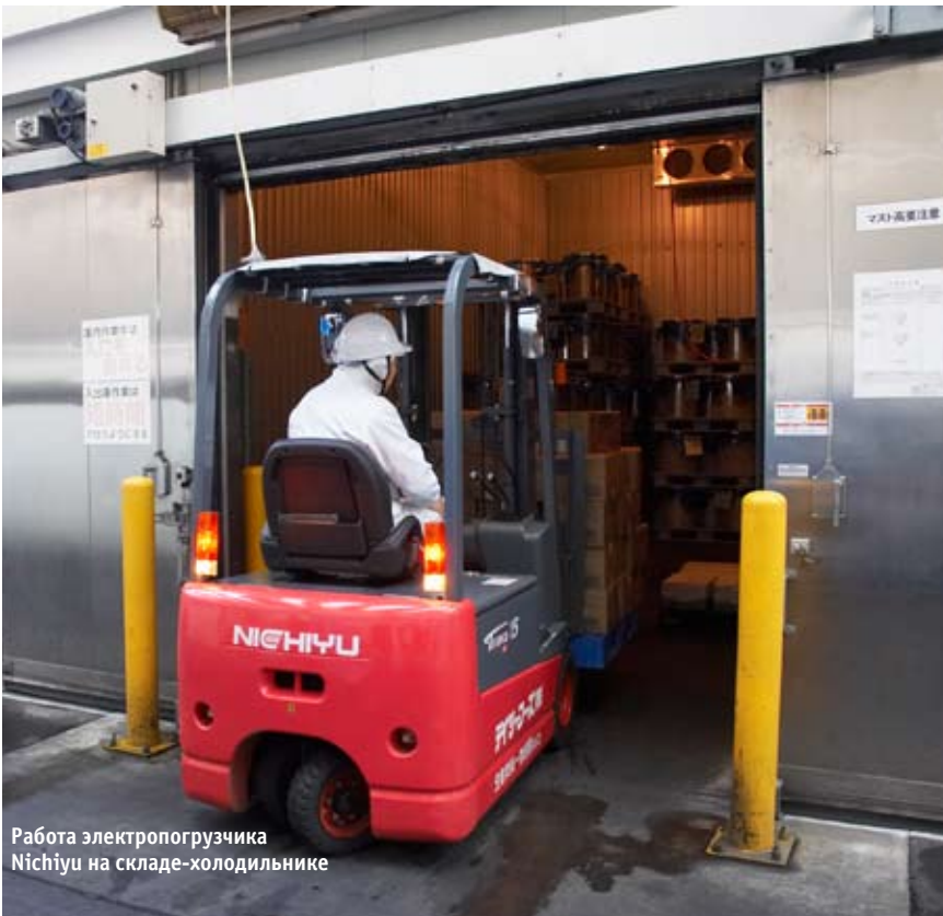
Работа электропогрузчика Nishiyu на складе-холодильнике