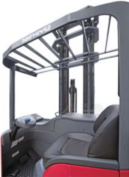
Кабина электропогрузчик FBR (FBRF)

тельной работы при -55^{\circ}\text{C} . (таблица). К холодостойким можно отнести и производимые Nichiyu погрузчики серии RP с трехступенчатой защитой от коррозии, работающие при температурах выше -10^{\circ}\text{C} .