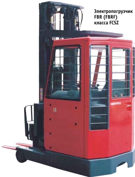
Электропогрузчик FBR (FBRF) класса FCSZ