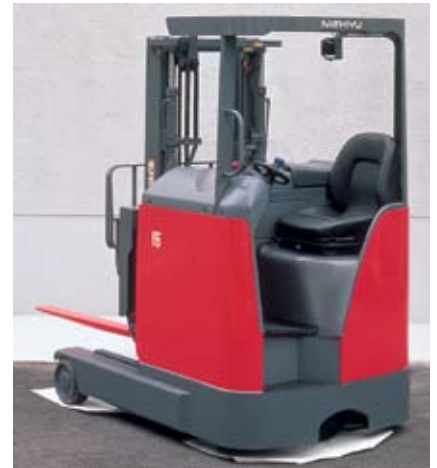
Электропогрузчик FBR (FBRF) класса FCS