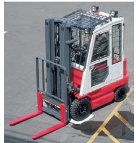
Электропогрузчик FB класса FCSZ